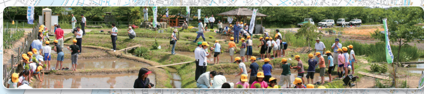
水の駅 明治用水土地改良区実習田(21枚田)